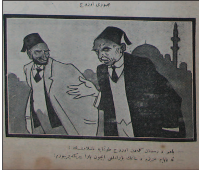
17 Mart 1924 / Akbaba Dergisi